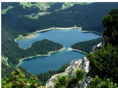
Obr. 2. – jezero (sladká voda)

Vodu obsahují těla rostlin, živočichů (člověk) a mnoho potravin.