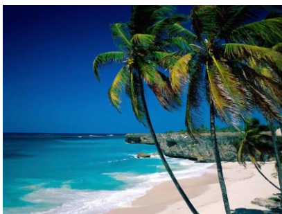
Obr. 1. – moře (slaná voda)