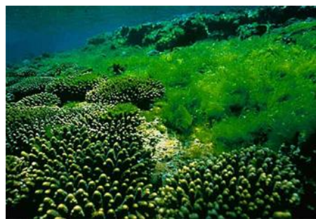
Obr. 4. – mořské řasy