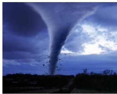
Obr. 2. - tornádo

Vzduch je obsažen ve vodě a půdě. Jediným zdrojem kyslíku na Zemi jsou zelené rostliny (pralesy a mořské řasy).