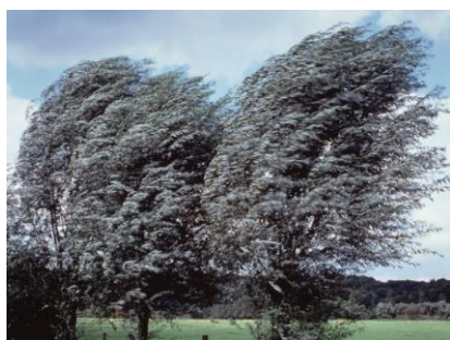
Obr. 1. – silný vítr