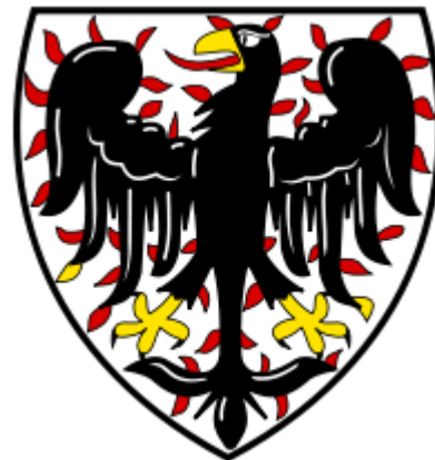
obr. č. 1 erb Přemyslovců