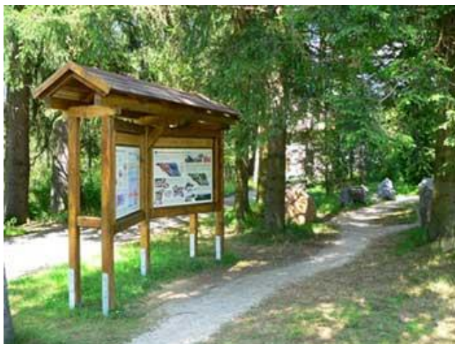
obr. č. 5 Naučná stezka

Blíže poznávat přírodu nám umožňují naučné stezky .