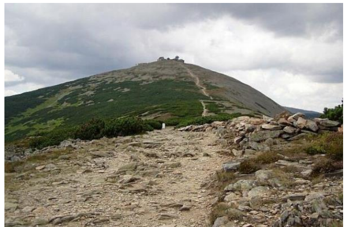
obr. č. 4 Sněžka - KRNAP