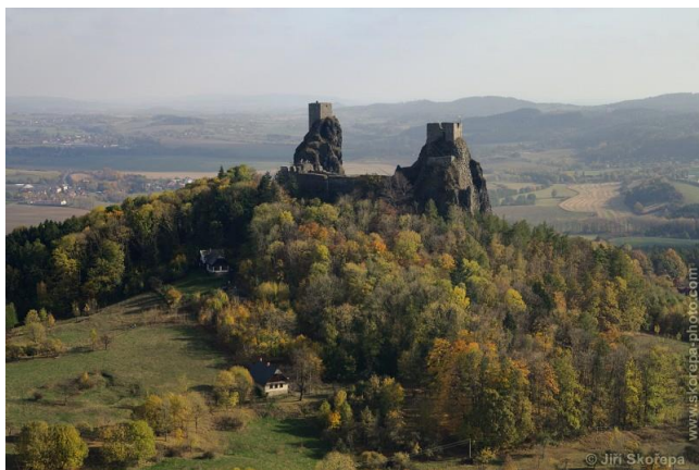
obr. č. 2 Trosky – CHKO Český ráj