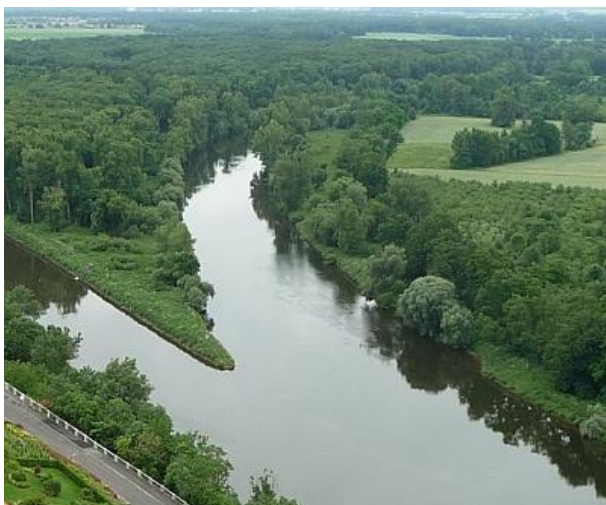
obr. č. 3 soutok