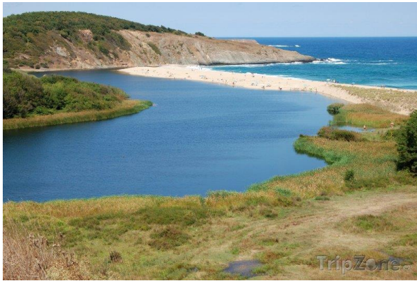
obr. č. 4 ústí

Ústí - místo, kde se řeka vlévá do moře (jiné řeky)