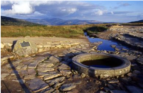
obr. č. 1 pramen řeky Labe

Každá řeka začíná jako pramen → potok (přibírá z levé a pravé strany přítoky) → řeka .