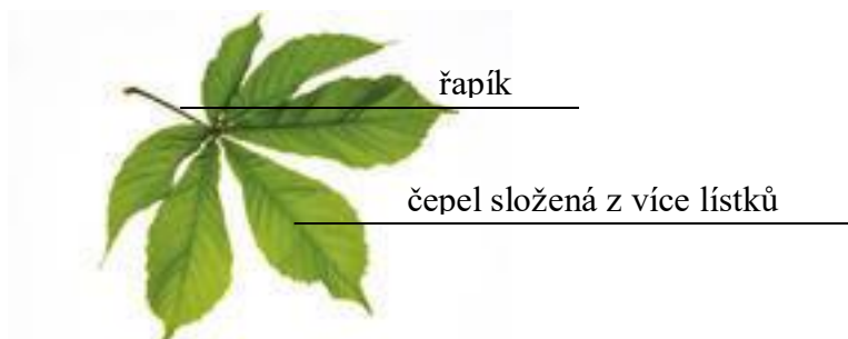
Obr. 3. – jírovec maďal