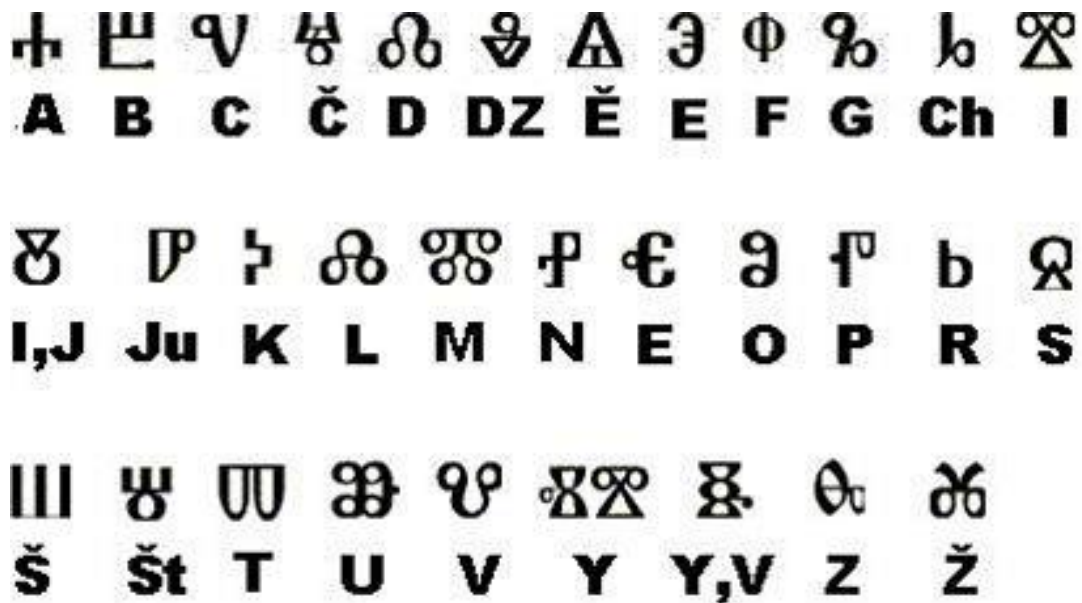
obr. č. 4 hlaholice

Konstantin později přijal v Římě jméno Cyril a brzy poté zemřel.