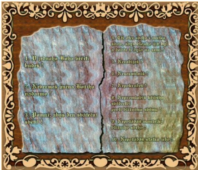
obr. č. 1 desatero přikázání

Křesťanství šířili kněží v německém nebo latinském jazyce → nikdo jim nerozuměl.