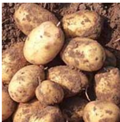
obr. č. 3 lilek brambor - hlízy