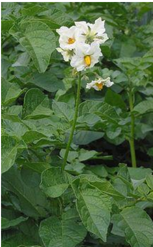
obr. č. 2 lilek brambor – květy a listy