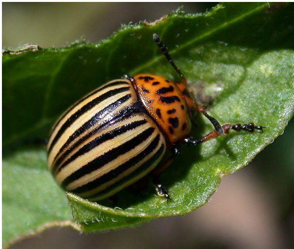
obr. č. 5 mandelinka bramborová