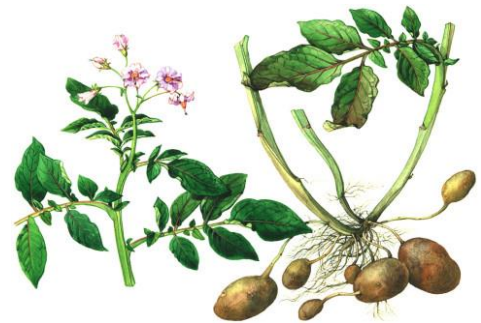
obr. č. 1 lilek brambor