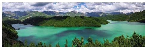
Přehradní jezero Bovillës